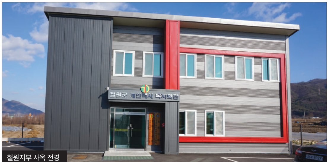
철원지부 사옥 전경

자가 정비하는데 필요한 소모품들은 시중 대비 약 2/3 가격으로 공동 구매해 필요할 때 마다 주문 배송 방식으로 공급받는다.