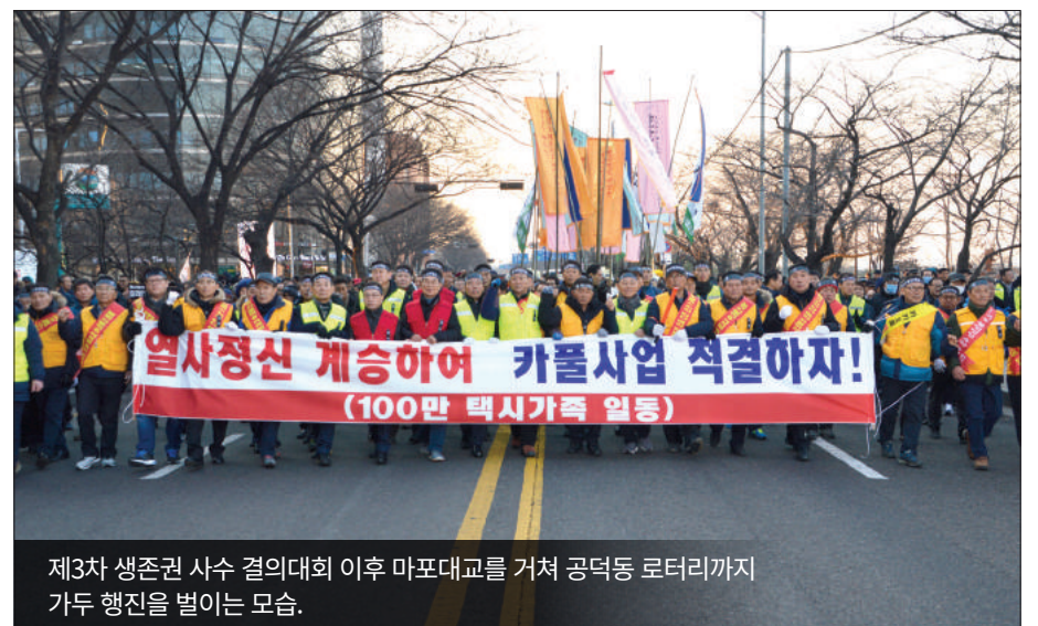
제3차 생존권 사수 결의대회 이후 마포대교를 거쳐 공덕동 로터리까지 가두 행진을 벌이는 모습.