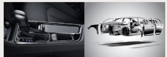
2세대 6단 자동변속기 혁신적인 차체강성