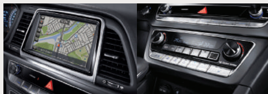
8인치 내비게이션(폰 커넥티비티) 듀얼 풀오토 에어컨(공기 청정 모드)