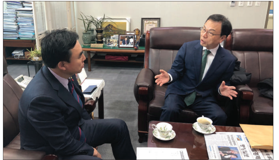
▲ 박권수 회장(사진 오른쪽)이 윤관석 의원에게 카카오 카풀의 문제점을 설명하고 있다.

윤관석 의원은 여당인 더불어민주당 소속이며 상임위원회는 국토교통위원회 소속으로 여당측 간사를 맡고 있다.