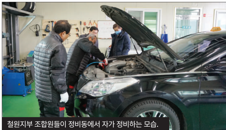
철원지부 조합원들이 정비동에서 자가 정비하는 모습.