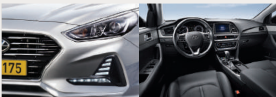
캐스캐이딩 그릴 & 세로형 LED DRL 편의를 고려한 인간공학적 설계